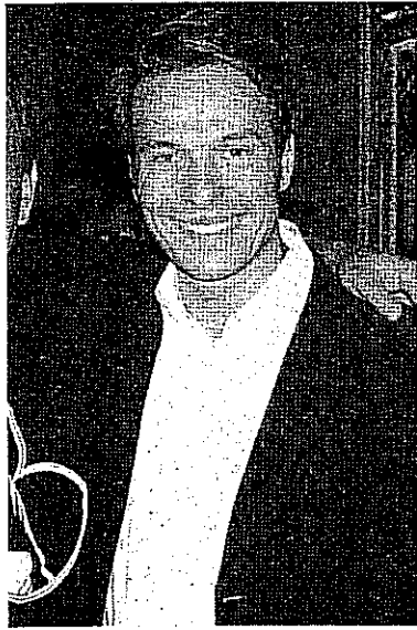
er of Magic di Saint Vincent

o il titolo di ical Arts. Ti - dicono i cocktail equi- ralità, perfe- : sottile iro-