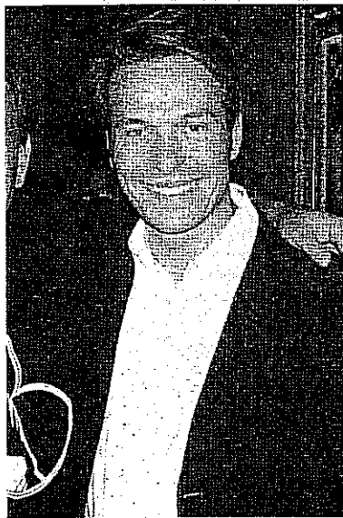
er of Magic di Saint Vincent

o il titolo di ical Arts. Ti - dicono i cocktail equi- valità, perfe- : sottile iro-